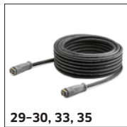
29-30, 33, 35