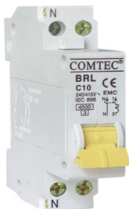
INTR. AUT. MCB 1M 4,5kA 10/1N/C